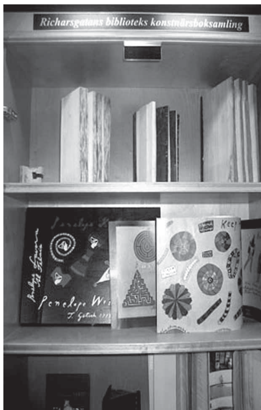
Konstnärsböcker i sitt eget skåp i Richardsgatans bibliotek.