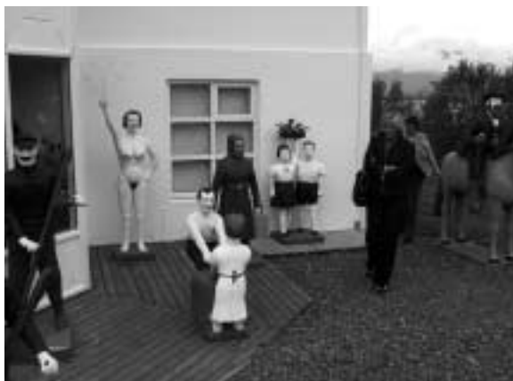
Skulpturer foran Safnasafnið