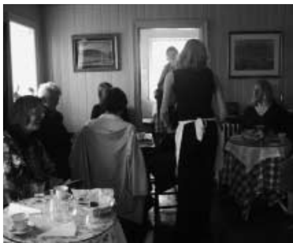
Lunch i Glaumbær.

Et annet viktig tema var hvorvidt IT kun er et redskap, eller om det er innholdet i de nye metoder som skal læres bort. Ingen av bibliotekene kunne vise til interaktiv undervisning, men noen var i planleggingsfasen for å kunne tilby dette. Alle de som uttalte seg, benytter IT i sin brukerundervisning. Den personlige kontakten, både ved