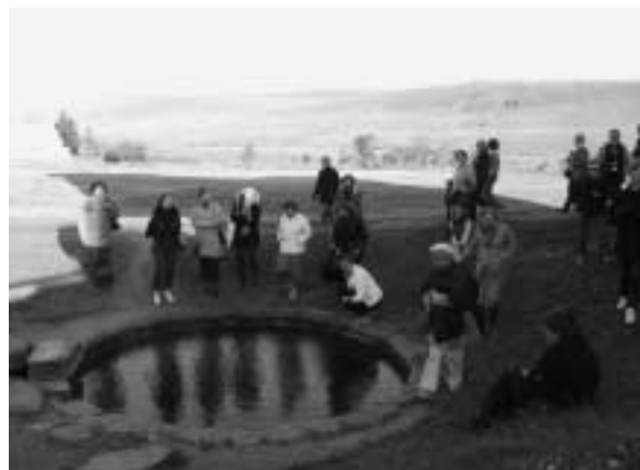
Ved Snorri Sturlusons bassin i Reykholt