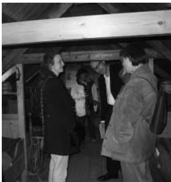
Lavt til loftet i Glaumber

Forbindelsen mellem bibliotek og studerende/ansat må gå fra at være frivillig til at være en forudsætning for at holde sig opdateret eller gennemføre en uddannelse.