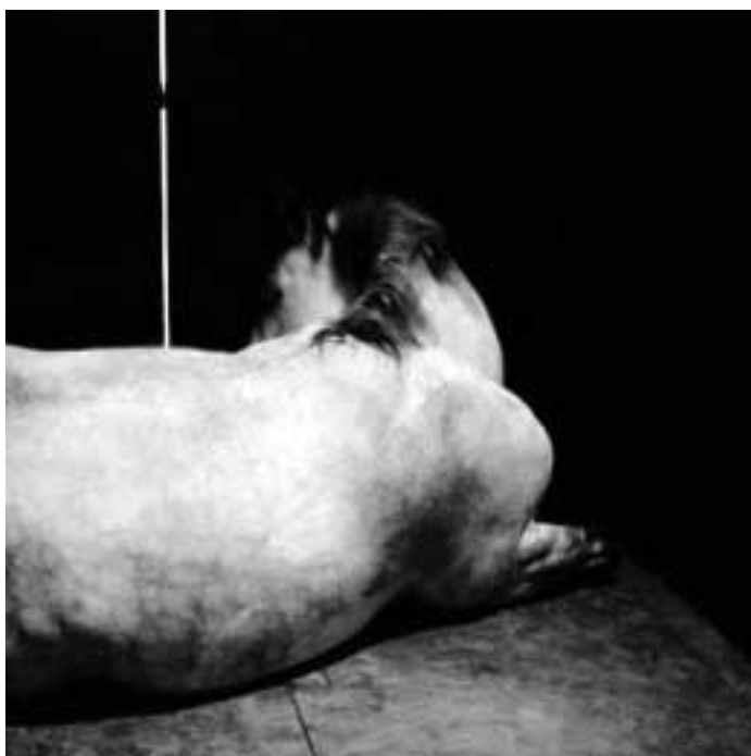
Victor Boulet: Awakening, 2002.

There is a lively and accomplished contemporary arts scene in Reykjavik, Iceland, but one that historically has had to