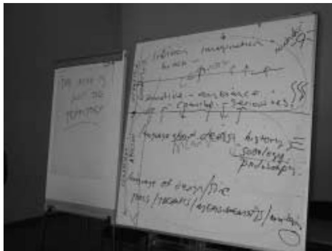
Guðmundur Oddurs filosofiske verdensbillede