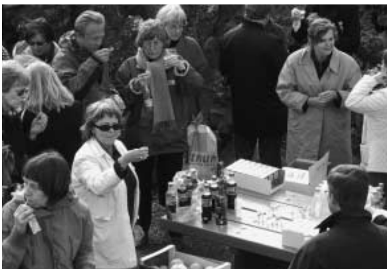
Endelig en pause