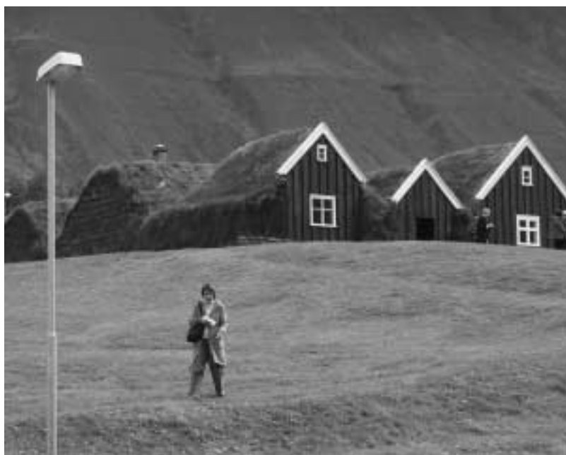
Den gamle gård i Hólar

Jeg vet at vi skulle ha snakket mer om opplæring og undervisning av brukerne, både interne og eksterne, men ettersom museets personale mener at de klarer seg selv og ikke ønsker å bruke tid på dette, og de fleste av våre