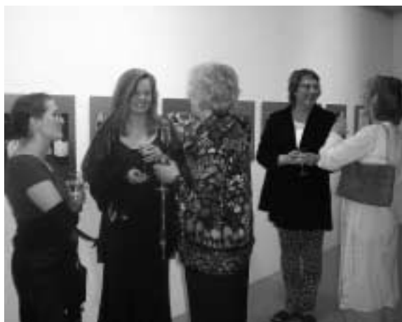
På Akureyri konstmuseum

Lördagen startade småkulet och regnigt när vi packade in oss i bussen för den spännande 14-timmarsfärden tvärs över hela ön ner till