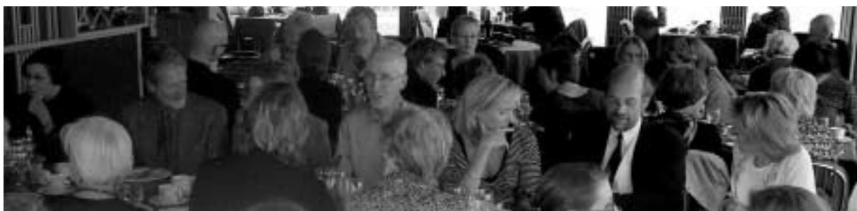
Festmiddag på Fiðlarinn