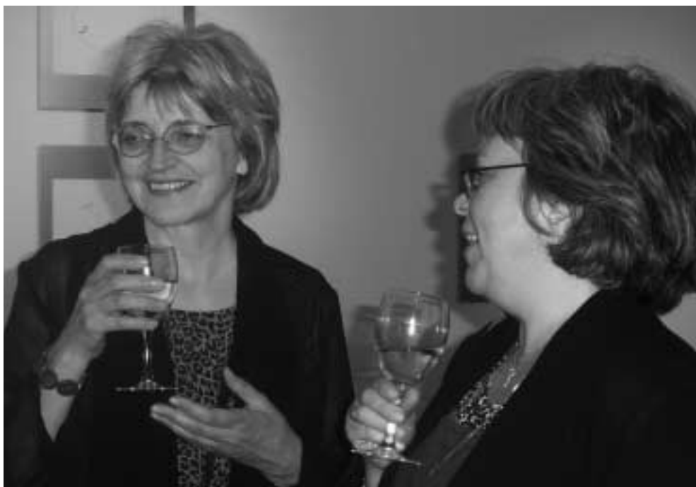
"Kunst i kriminalromaner" diskuteres

We should have a better collaboration with the public libraries, especially in connection with the exhibitions at the museum.