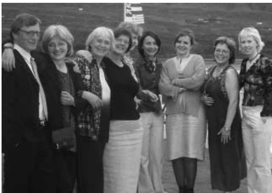
På Fiölarinns balkong

Man bör våga öppna sitt glada hjärta och rubba litet vår existens.