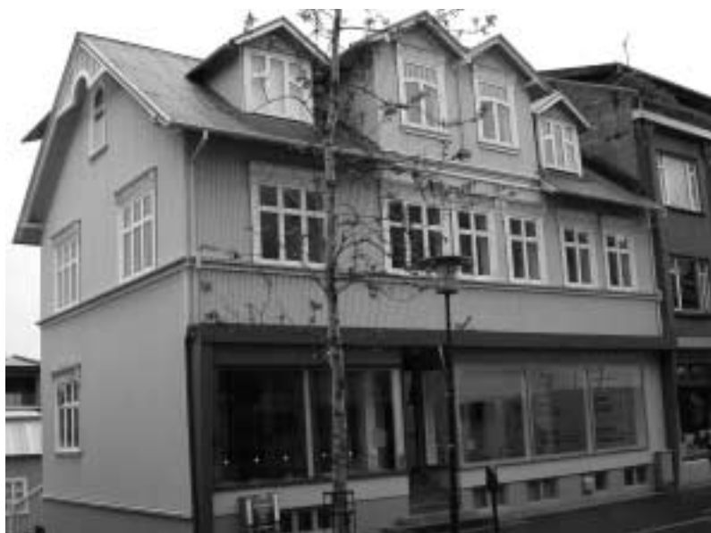
Safn i Reykjavík.